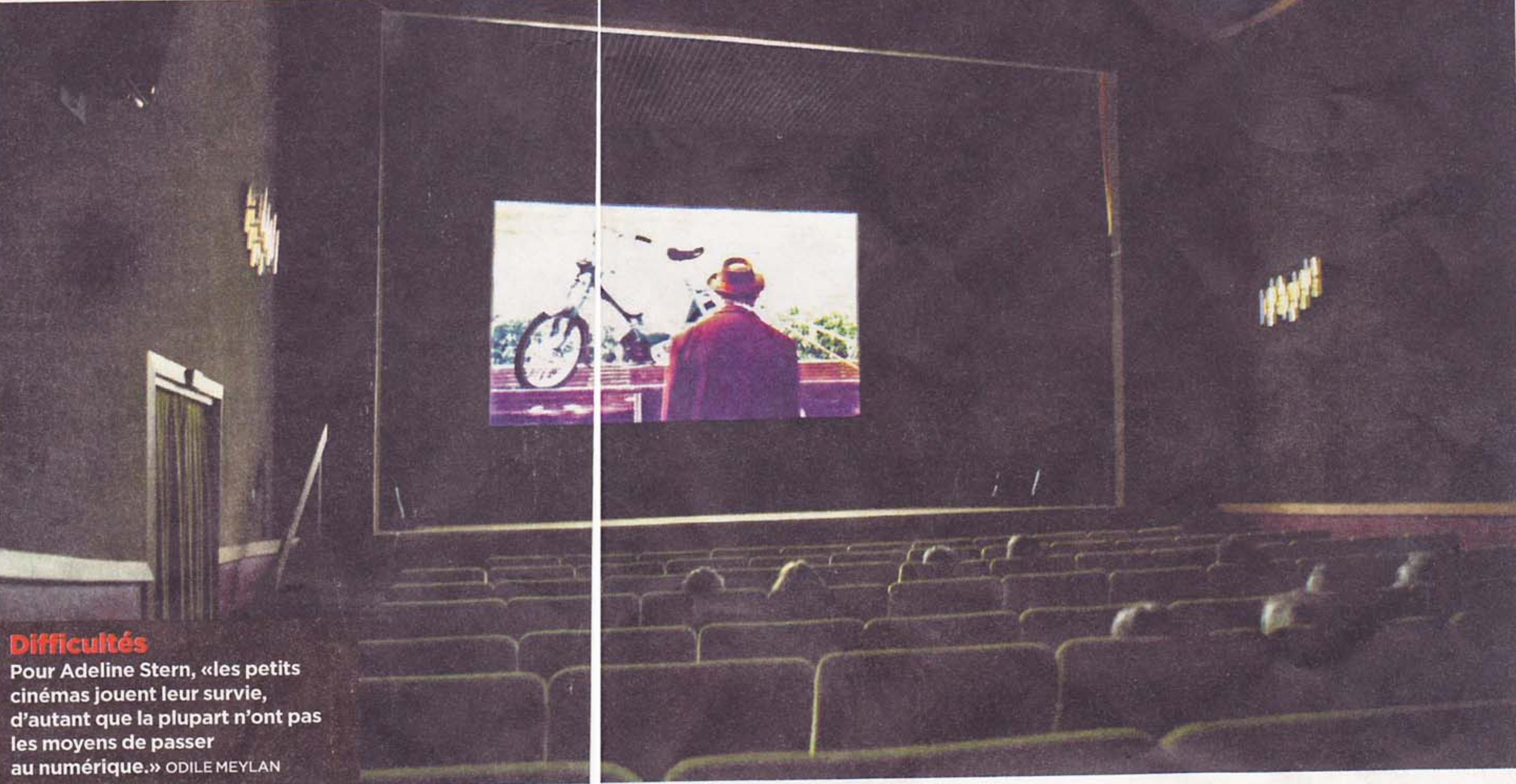
Difficultés Pour Adeline Stern, «les petits cinémas jouent leur survie, d'autant que la plupart n'ont pas les moyens de passer au numérique.» ODILE MEYLAN

Ainsi, le Bellevaux, dernier cinéma de quartier dans le nord de Lausanne, a mis