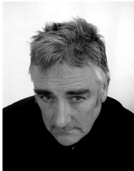
Figure incontournable de la scène expérimentale internationale, Fred Frith sera à l'honneur à travers le documentaire Step Across the Border , projeté à 17h en présence du réalisateur Nicolas Humbert. Dès 20h30, Fred Frith se produira en solo sur la scène du CityClub lors d'un concert unique et marquant, où il pourra exprimer et partager tout son talent d'improvisateur et de performer .

Le dimanche 1er avril dès 17h, le CityClub accueille le légendaire guitariste anglais Fred Frith lors d'une soirée d'exception.